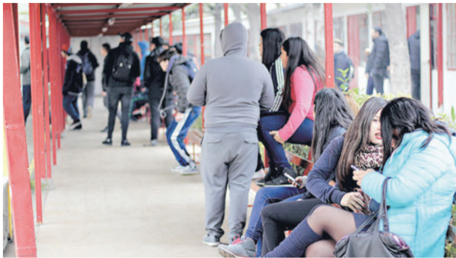
ESCUELA REINSECIÓN FUNDACIÓN SUMATE